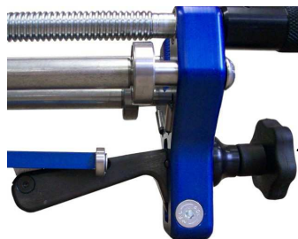
Dolny chwytak rolkowy